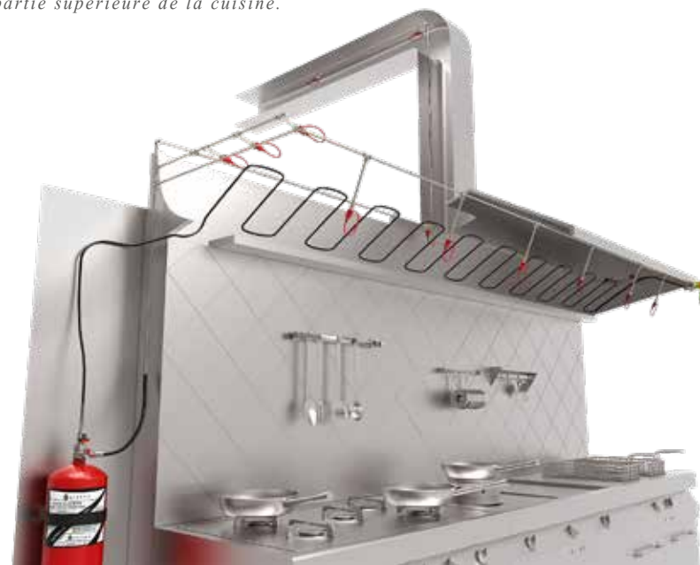
Section de la partie supérieure de la cuisine.