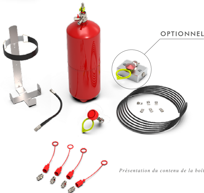
Présentation du contenu de la boîte.